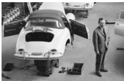
Ферри Порше в цеху сборки модели 356

очередным достижениям, победам в гонках и инновациям. Ведь для Porsche всегда самым главным было умение превращать мощность в скорость и успех. Но дело при этом не в количестве лоша-